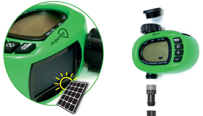
Schematische Darstellung des Stecksystems

Erweiterbar mit zusätzlichen Modulen wie z. B. einem solarbetriebenen Computer für die automatische Bewässerung