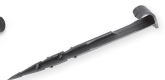
Montageanker 20 Stück