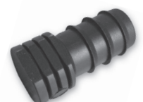
Endstück Sicherung 5 Stück