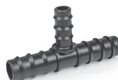
3-fach T-Verteiler 5 Stück