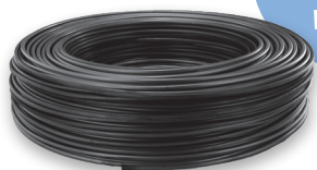
Tropfschlauch mit Druckkompensation 60 m