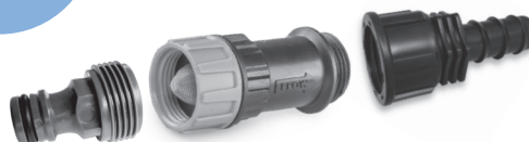
Druckminderer mit Filtersieb inkl. Hahnanschluss und Schlauchadapter